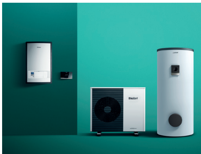
Tepelné čerpadlo aroTHERM plus, externý zásobník teplej vody uniSTOR, závesný hydraulický modul, systémový regulátor sensoCOMFORT