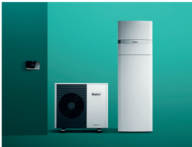
Tepelné čerpadlo aroTHERM plus, vnútorná jednotka uniTOWER plus, systémový regulátor sensoCOMFORT